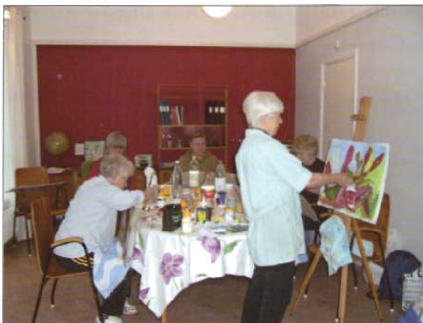
Målargruppen i aktion.