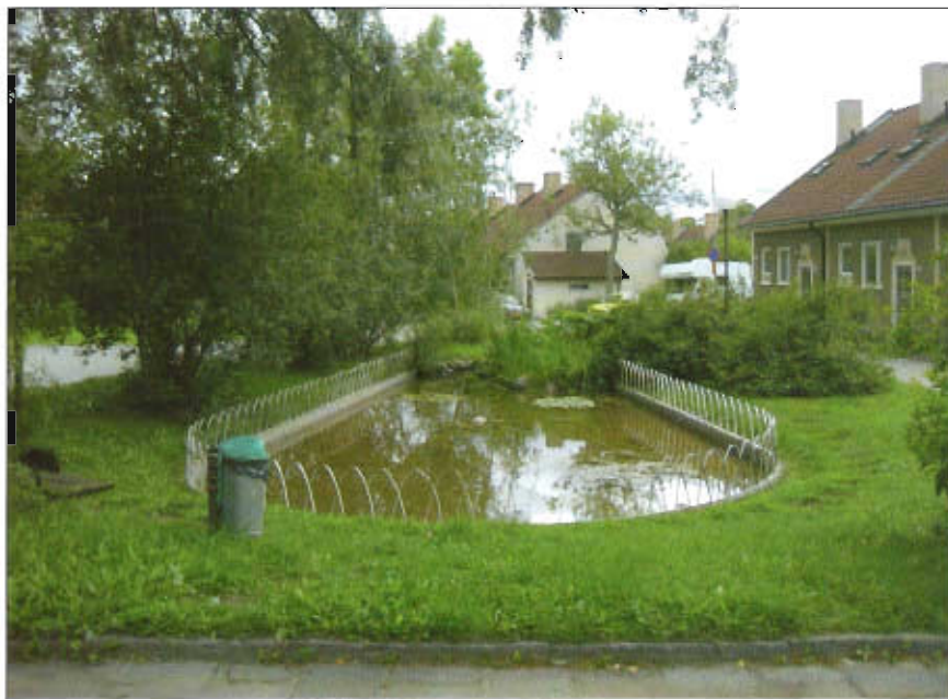
Parken vid Söndagsvägen i Skönstaholm.

En försiktig upprustning med utgångspunkt från originalritningarna föreslås. Bl.a. förbättrad tillgänglighet till sittplatsen och perennplanteringar som kompletteras.