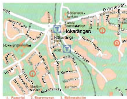
1. Fagerlid 2. Starrmyran 3. Skönstaholm