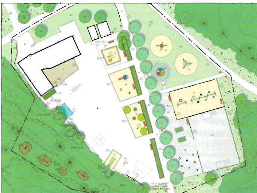
Planskiss för Starrmyran.

För frågor går det bra att vända sig till Exploateringskontoret 508 263 81. Illustrationer: Tema landskapsarkitekter