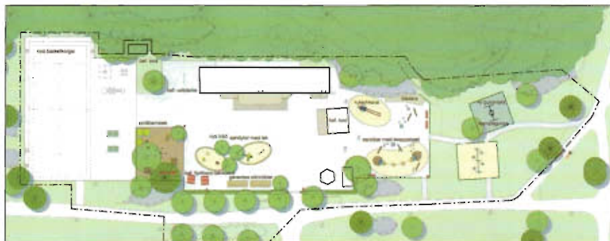
Planskiss för Fagerlid.

Det fullkomlig bubblar och sjuder av olika aktiviteter i Fagerlidsparken.