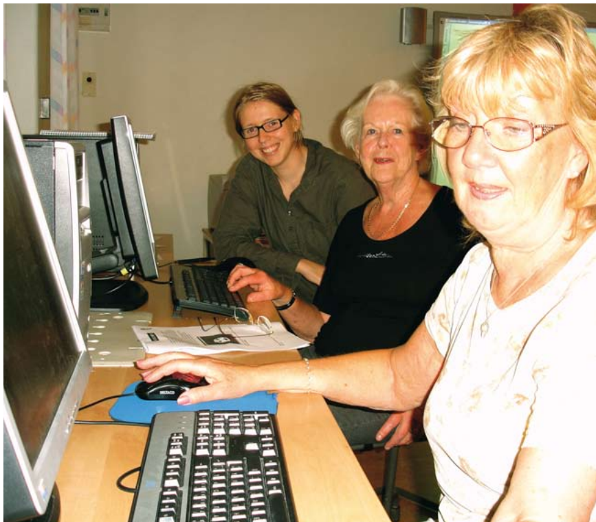
Så här roligt är det att äntligen få lära sig använda en dator... Men nu gäller det att skärpa sig...