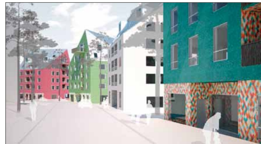
Gatuperspektiv längs Saltvägen (Byggestal/Backhans och Hahn Arkitekter) enligt förslaget i start-PM.

Det finns också ett förslag på ny bebyggelse mellan Saltvägen och tunnelba-